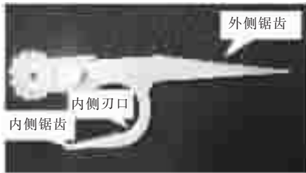
图2 导线异物处理作业部