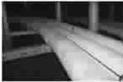
图 3 外置探测光缆安装示意图

(1) 无锡某电力管廊 10 kV 电力电缆采用了外置式光纤测温系统进行在线监测。状态检测主机和 DTS 测温主机均安装于监控室的控制柜中,探测光缆沿着电缆表面敷设,且每隔 1 m 使用尼龙扎带或固定夹具进行绑扎,探测光缆安装示意如图 3 所示。