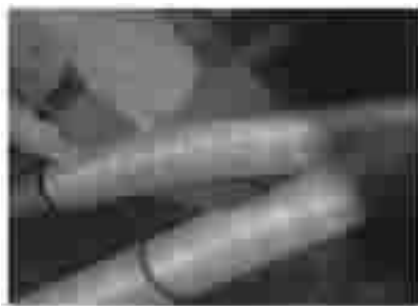
图 4 内置探测光缆安装示意图

(2) 无锡某小区 1 号公配所至 2 号楼的 10 kV 电力电缆采用了内置式光纤测温系统进行在线监测。状态检测主机和 DTS 测温主机均安装于公配所的控制柜中,采用光纤复合电缆中的内置光纤来进行探测,安装示意如图 4 所示。