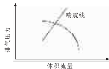
图1 离心空心机进口压力恒定时流量压力特性曲线

值,空压机就会发生喘振,该种喘振称为自然喘振。在运行过程中设定空压机的出口压力(排气压力)小于标定压力(自然喘振压力)就可以避免空压机的喘振 [1] 。