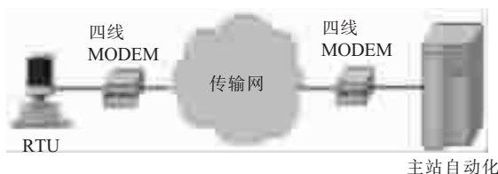
图 1 变电站网络化改造前运动传输结构

待改造的变电站改造前采用的是四线专用模拟通道,规约采用 CDT 或者 IEC101 规约。总控串口数据经过 MODEM 转换为四线模拟信号,然后经过通信传输网到达主站 [1] ,如图 1 所示。