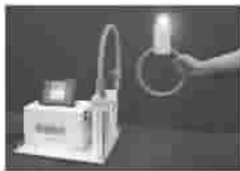
图 2 基于磁共振的电力传输系统

基于电磁共振耦合原理的整个装置必须包含 2 个线圈，每一个线圈都是一个自振系统。其中一个为发射装置，与能量源相连，它利用振荡器产生高频振荡电流，通过发射线圈向外发射电磁波，在周围形成了一个非辐射磁场，即将电能转换成磁场；当接收装置的固有频率与收到的电磁波频率相同时，接收电路中产生的振荡电流最强，完成磁场到电能的转换，从而实现电能的高效传输。在日本，2009 年 8 月长野日本无线也宣布开发出基于磁共振的送电系统，如图 2 所示。当送电受电部之间的传输距离为 40 cm 时，传输的效率达到了 95%。